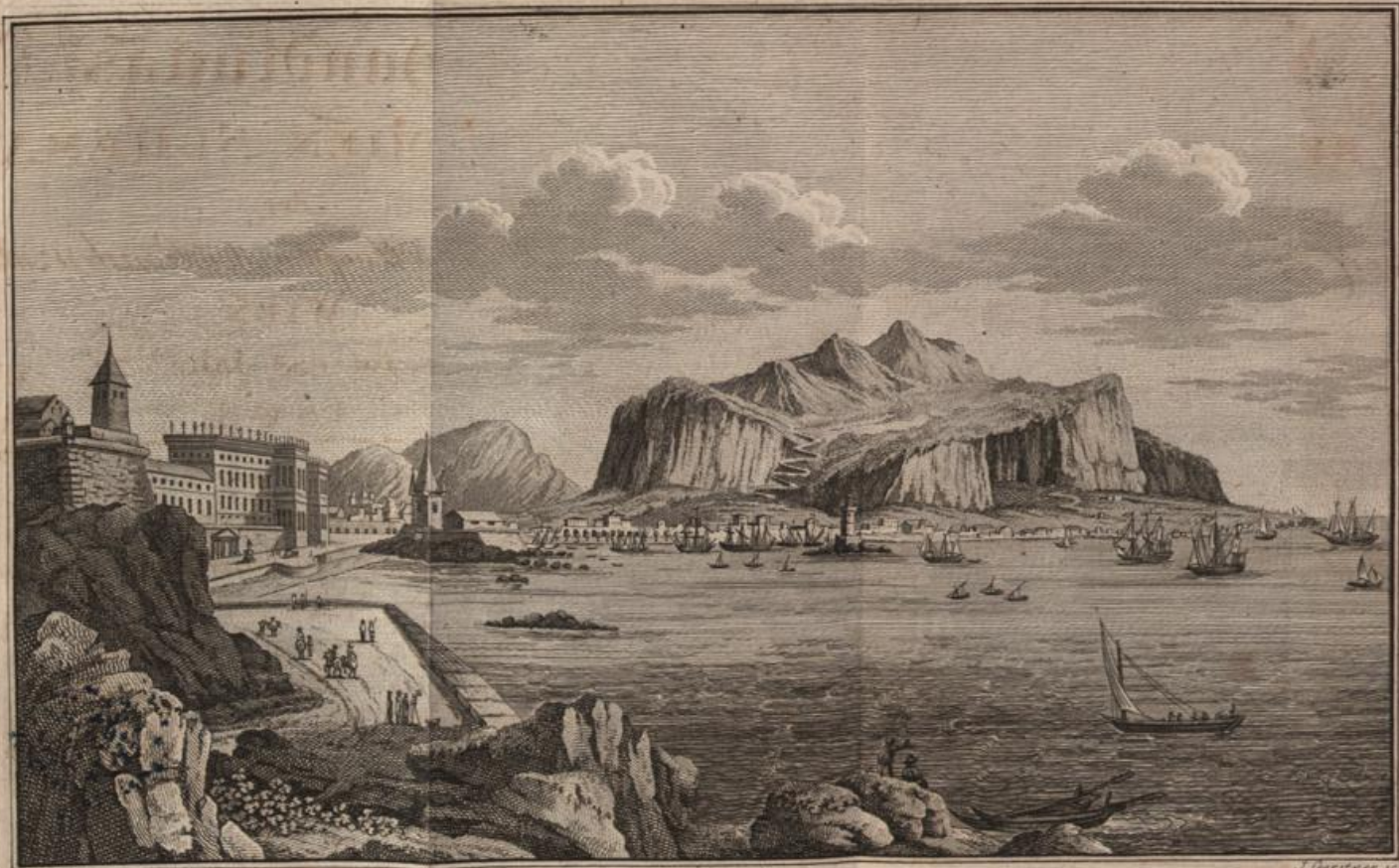
Ansicht der Stadt Palermo und des Berges Pellegrino.