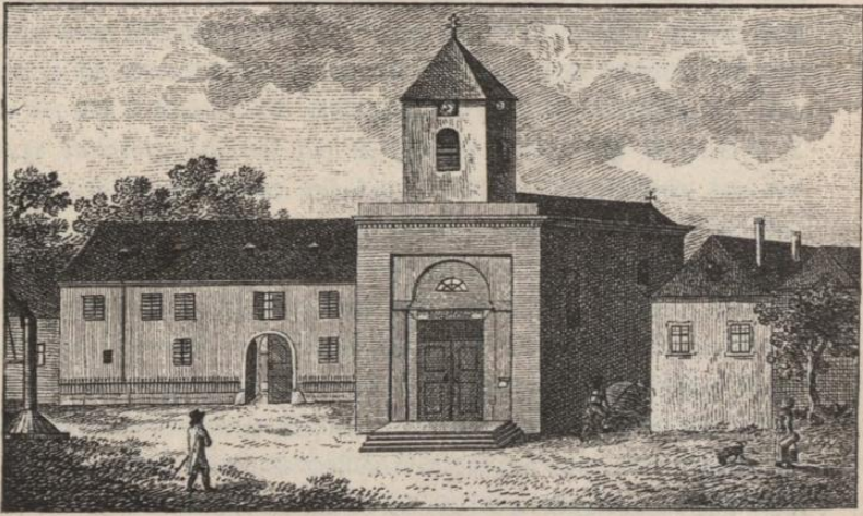
Mannheim Praforiumhaus, St. Wolfgangkapelle und Schulhaus vor dem Umbau der Kirche im Jahre 1790.