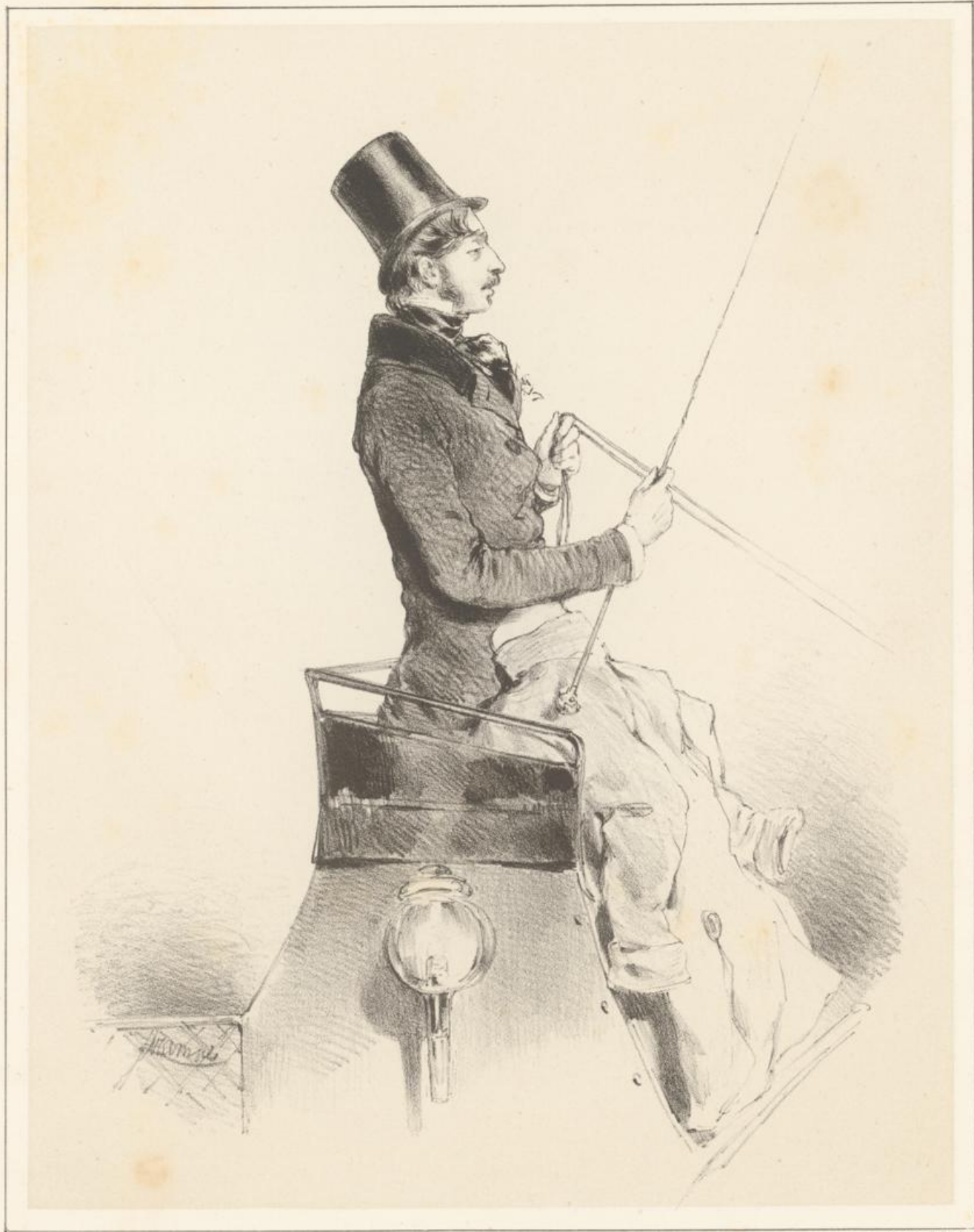
Gedr. b. J. Raub.