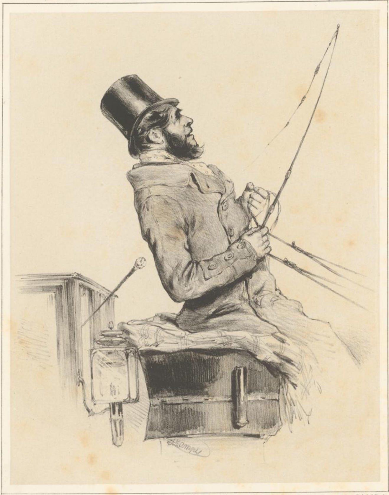
Gebr. v. J. Rath