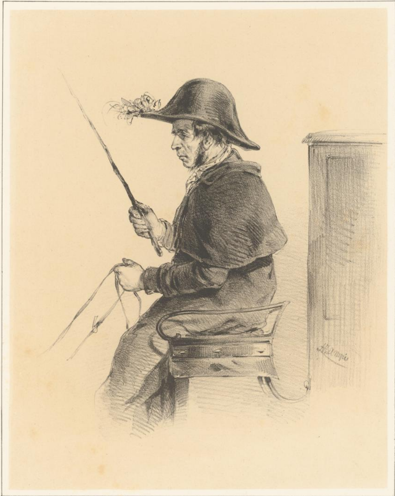
Gebr. H. J. Pash