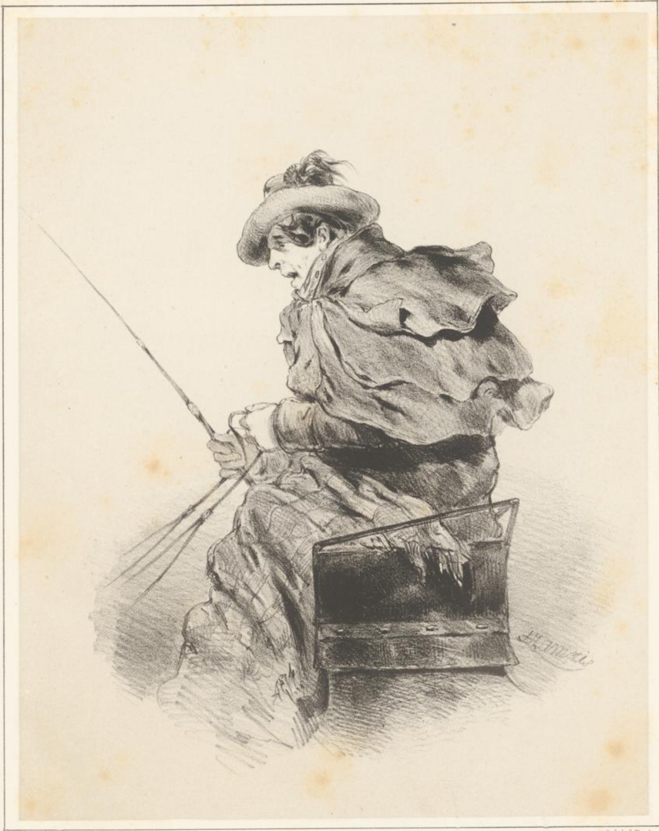
Gedr. b. J. Rath.