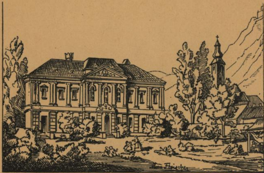
Grtes ält. Kinder-Asyl „Humanitas“ in Kahlenbergerdorf bei Wien.