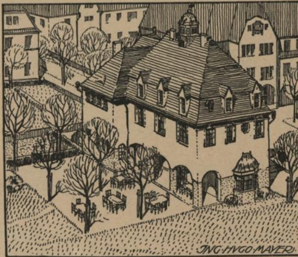
GASTHAUS MIT FESTSAAL

Die Kaiser Karl-Kriegerheimstätte in Aspern soll wohl die erste, aber bei weitem nicht die einzige solche Siedelung in Wien sein, denn die Zahl der Kriegsbeschädigten ist im Verlaufe des Weltkrieges so groß geworden, daß von allen Kreisen unermüdlich weiter gesorgt werden muß, um recht viele solcher Anlagen ins Leben rufen zu können. Es wird die Ehrenpflicht eines jeden einigermaßen vermögenden Bewohners von Wien sein, Förderer des Wiener Kriegerheimstättenfondes zu werden und im Dienste dieses Fürsorgegedankens sein Möglichstes zu leisten, um unseren Volksgenossen, die im Kampfe um das teure Vaterland ihre Gesundheit teilweise eingebüßt haben, eine Heimstätte zu schaffen und ein bleibendes nutzbringendes Denkmal zu errichten für den Gemein Sinn und die Vaterlandsliebe unseres Volkes. Viele Unternehmungen und zahlreiche wohlhabende Einzelpersonen werden wohl dem bereits gegebenen Beispiel folgen und in der Form von Widmungen der Beträge für einzelne Wohnungen, für ganze Häuser und für ganze Hausgruppen oder auch durch kleine Geldbeträge diese schöne Sache fördern.