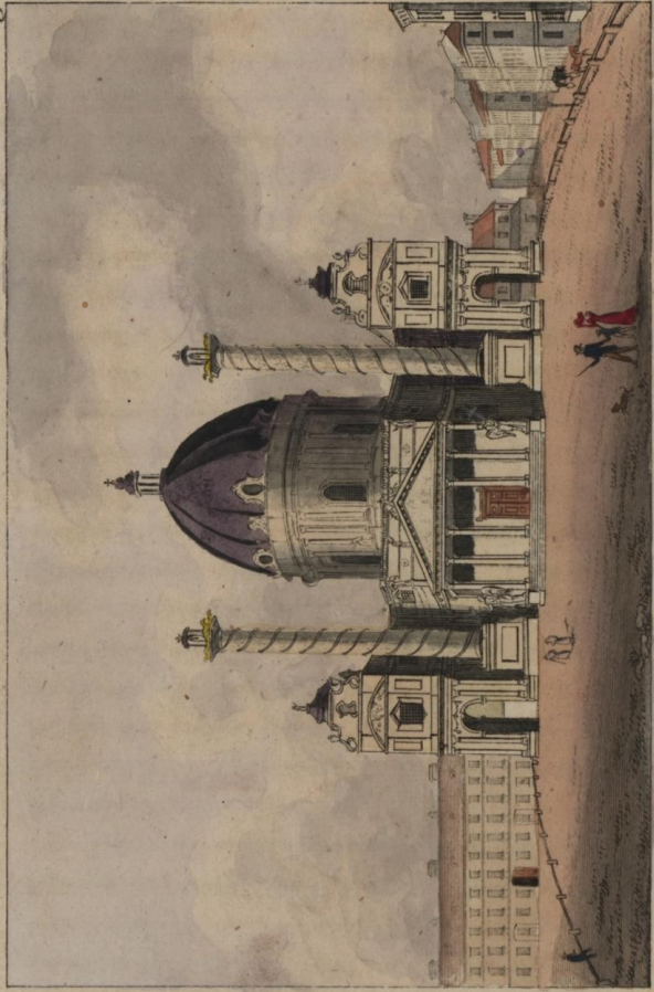
ԵԿԵՂԵՑԻ ՄՐԲՈՅԼ ԿԱՌՈՂՈՍԻ