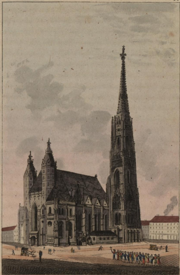
ԵԿԵՂԵՅԻ ՍՐԲՈՅՆ ԱՏԵՓԸՆՈՍԻ