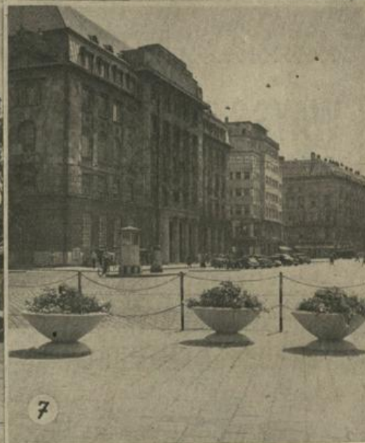
1. und 2. Am 2. August wurde von Bürgermeister Jonas eine neue Brücke über die Liesing eröffnet. Die Brücke ist im Mai 1951 bei der damals auftretenden Hochwasserkatastrophe zerstört worden. — 3. und 4. Im Kaufhaus Gerngroß auf der Mariahilfer Straße ist gegenwärtig eine Burgenlandausstellung zu sehen, die am 1. August von Landeshauptmann Karall, in Anwesenheit von Vizebürgermeister Honay und Vizebürgermeister Weinberger, eröffnet wurde. Die Ausstellung zeigt viel Interessantes aus dem östlichsten Bundesland Österreichs. — 5., 6. und 7. Die Stadtgardendirektion, die immer bemüht ist, unsere Stadt mit gepflegten Parkanlagen zu schmücken, hat sich eine neue Attraktion ausgedacht. Vor kurzem wurden beim Schottentor riesige Blumentöpfe aus Beton aufgestellt, die mit ihrem bunten Blütenschmuck das Bild dieser Kreuzung erfreulich beleben.