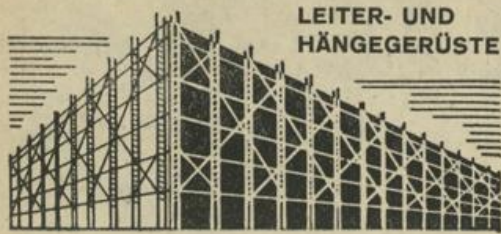
LEITER- UND HÄNGEGERÜSTE