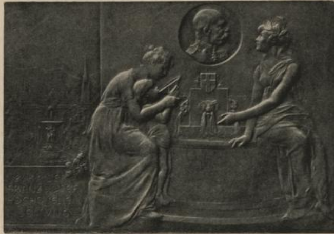
Plakette, geprägt anlässlich des Durchschlages des Stollens durch die Göstlinger Älpe.