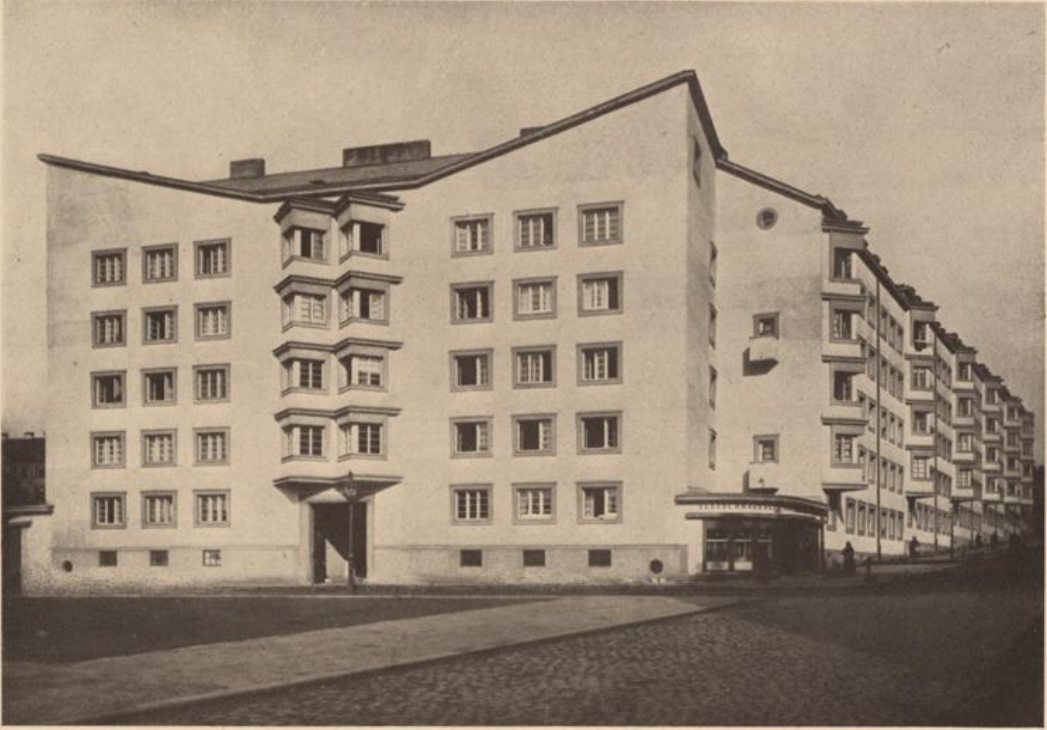
Wohnhausanlage XIII. Rottstraße