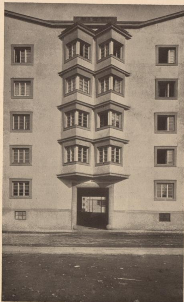
Wohnhausanlage XIII. Rottstraße