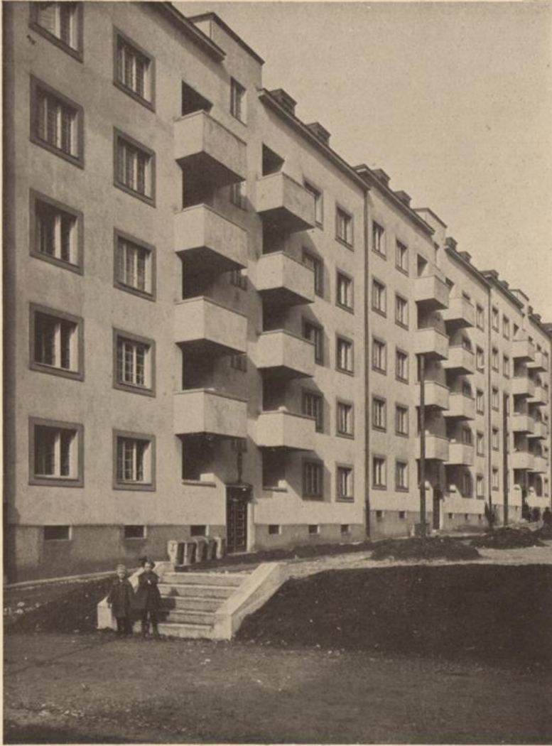
Wohnhausanlage XIII. Rottstraße