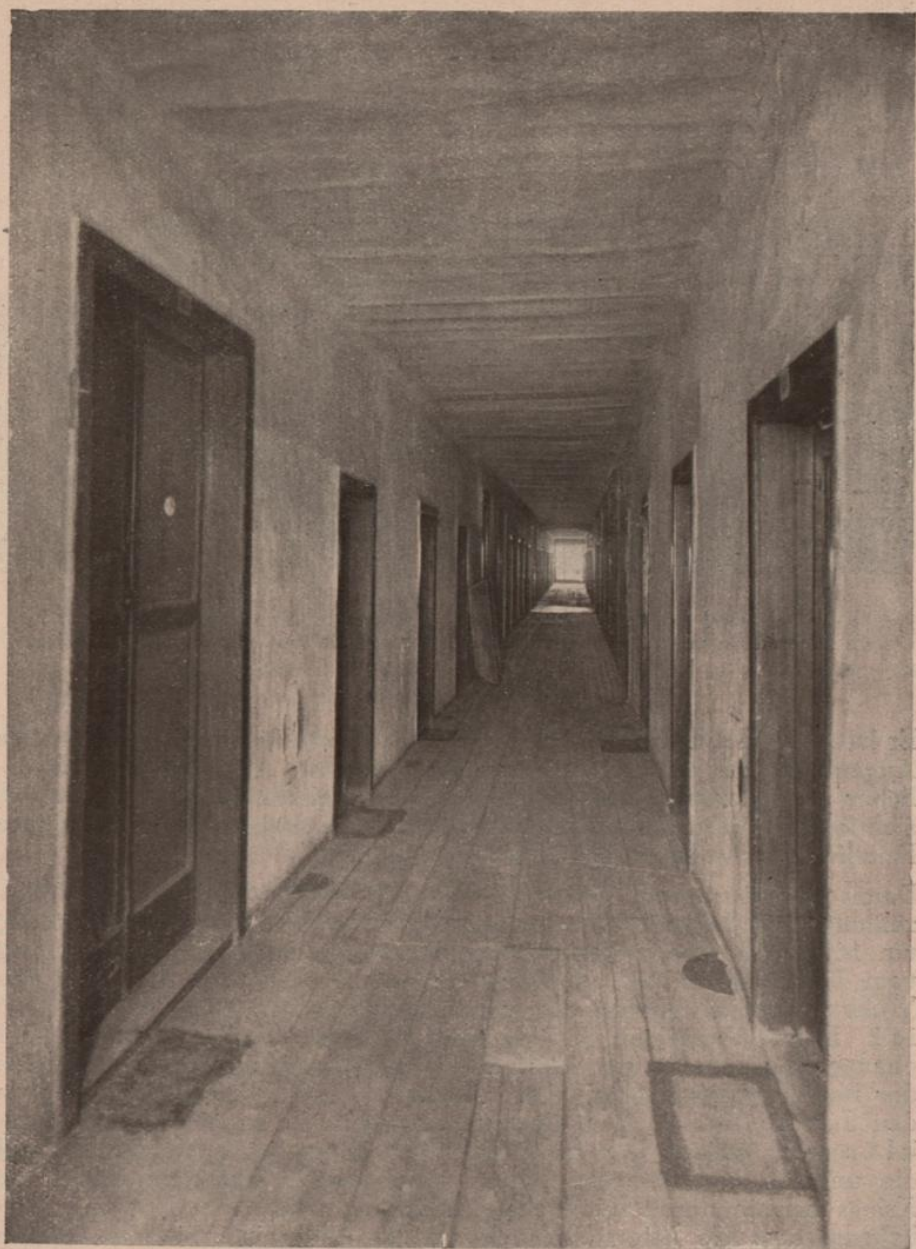
Der Gang in dem Hause III, Schimmelgasse 17 (erbaut 1859). Das sind die Wohnungstüren, die in diesen Gang münden.