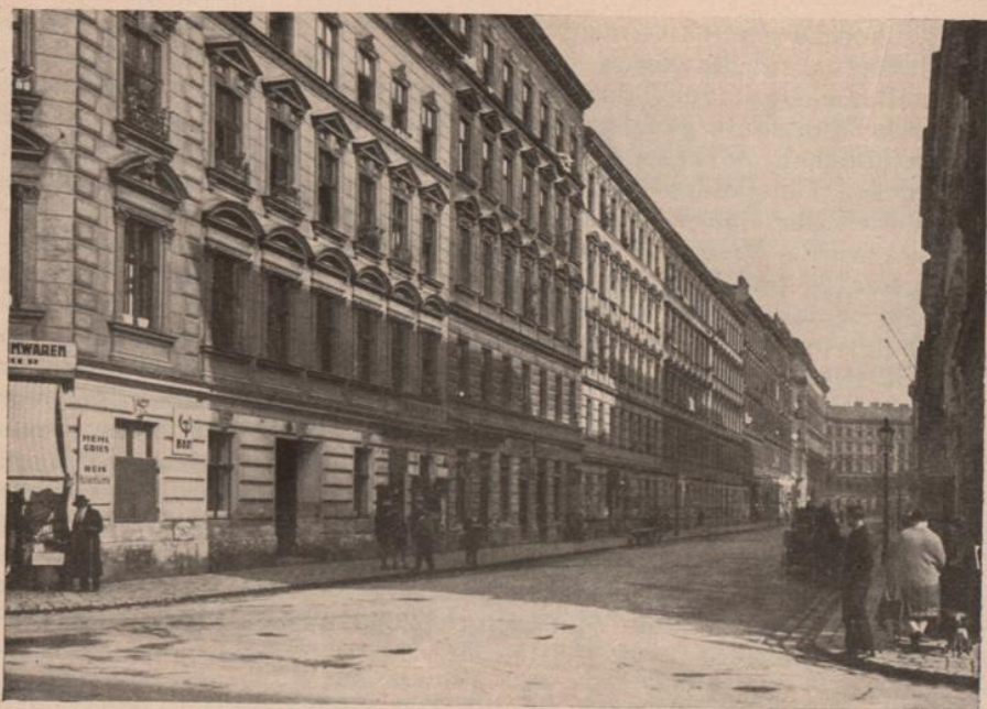
Ein typisches Straßensbild aus einem Stadtviertel, in dem die private Bautätigkeit um 1900 Kleinwohnungen produziert hat. (XX, Karajangasse.)