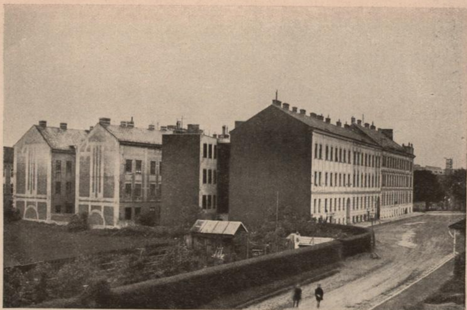
Dichte Bebauung mit engen Höfen und Seitentrakten mit Feuermauern auch in den äußeren Bezirken bei zweistöckiger Bauweise. Beispiel aus dem XIX. Bezirk.

Er hat seine Frau und seinen Haushalt zurückgelassen, bis der günstige Augenblick zur wirklichen Absiedlung eintritt. Auch bei sonst möglicher Abwanderung, zum Beispiel in überseeische Länder, handelt es sich zumeist nur um einzelne erwerbsfähige Personen, die für ihre Familie ihre Wohnung erhalten.