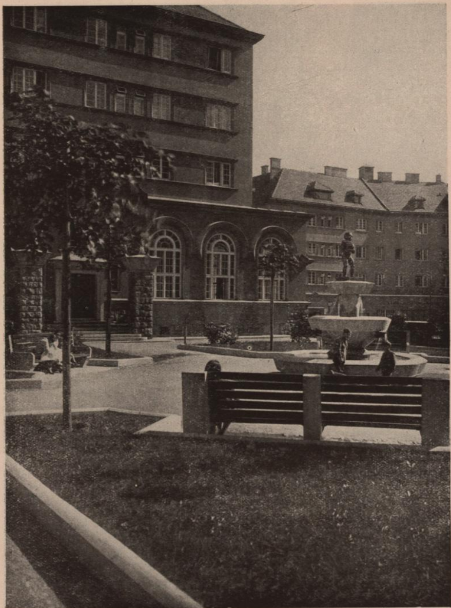
Aussehen des Hofes in einer städtischen Wohnhausanlage (XVI. Bezirk, Sand- leitengasse).