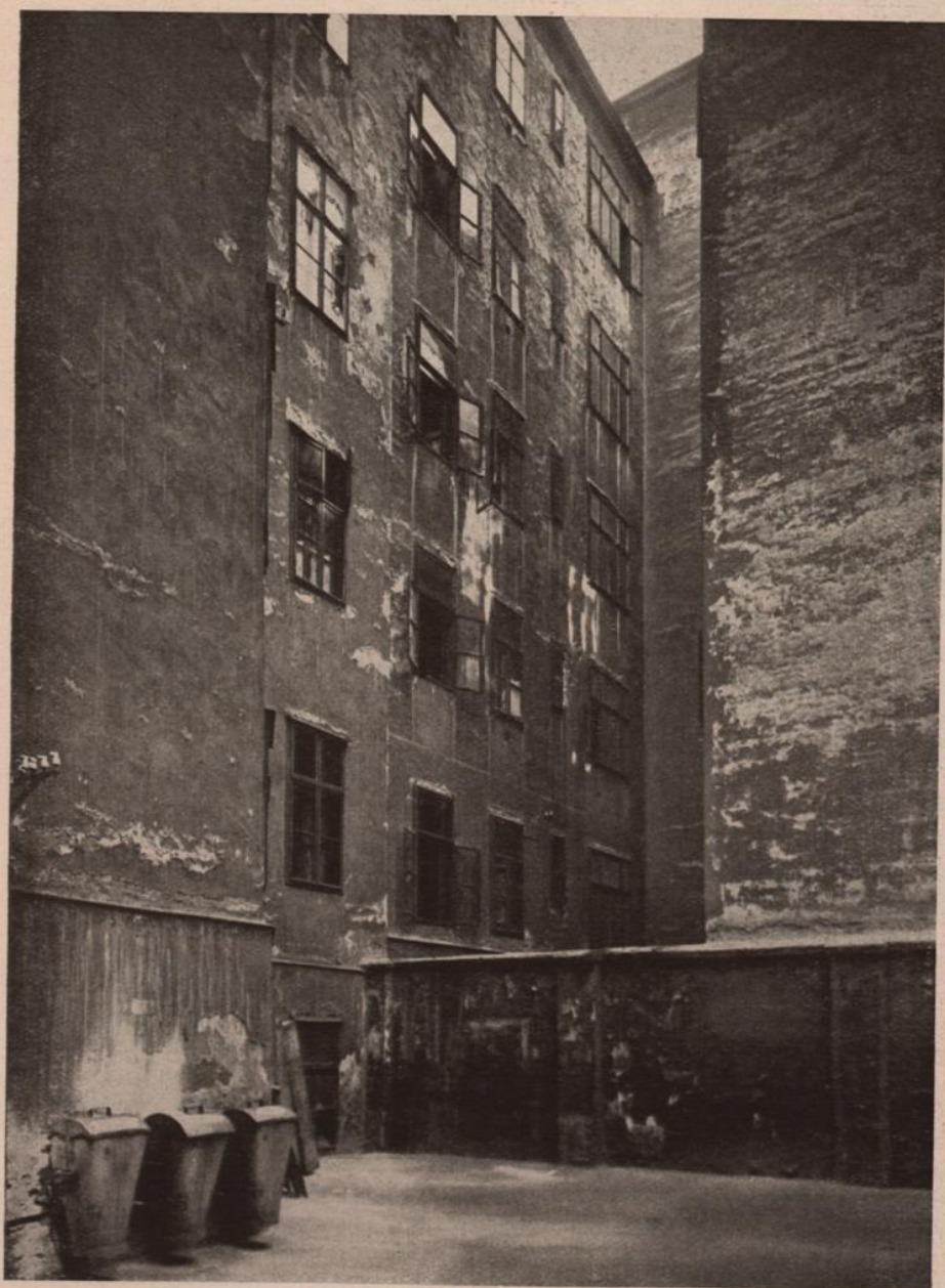
Das typische Aussehen der zu den Häusern auf Seite 14 gehörigen Haushöfe.