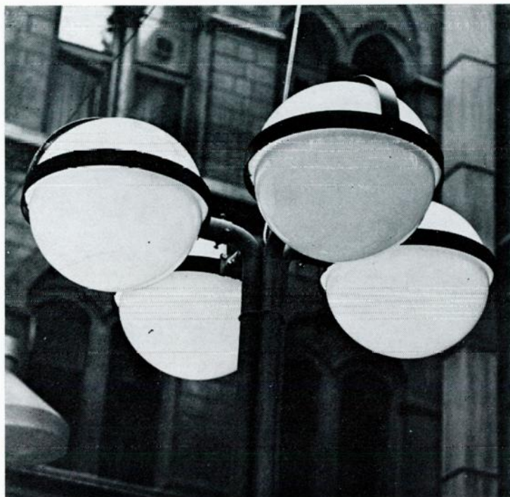
So werden die Beleuchtungskörper der Fußgängerzone Favoritenstraße aussehen