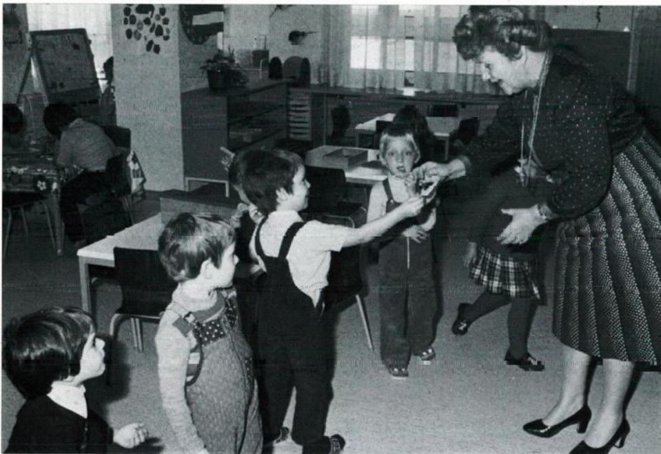
Frau Vizebürgermeister Gertrude Fröhlich-Sandner (Amtsführender Stadtrat für Bildung, Jugend, Familie) bei der Eröffnung des städtischen Kindertagesheimes im 23. Bezirk, Porschestraße 17