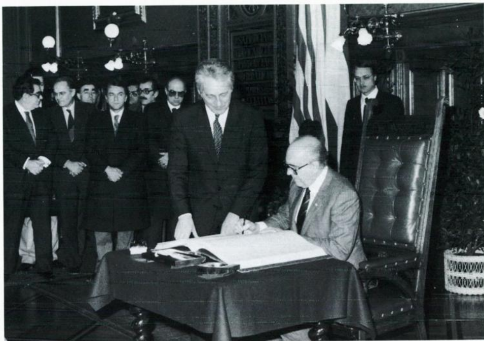
Der Ministerpräsident der Hellenischen Republik, Prof. Andreas Papandreu, trägt sich in das Goldene Buch der Stadt Wien ein. Bürgermeister Leopold Gratz empfing den Gast