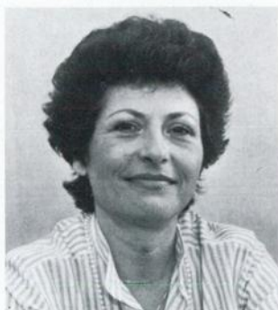
Friederike Seidl, SPÖ Amtsführender Stadtrat für Personal, Rechtsangelegenheiten und Konsumentenschutz