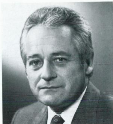
Leopold Gratz, SPÖ Bürgermeister der Bundeshauptstadt Wien