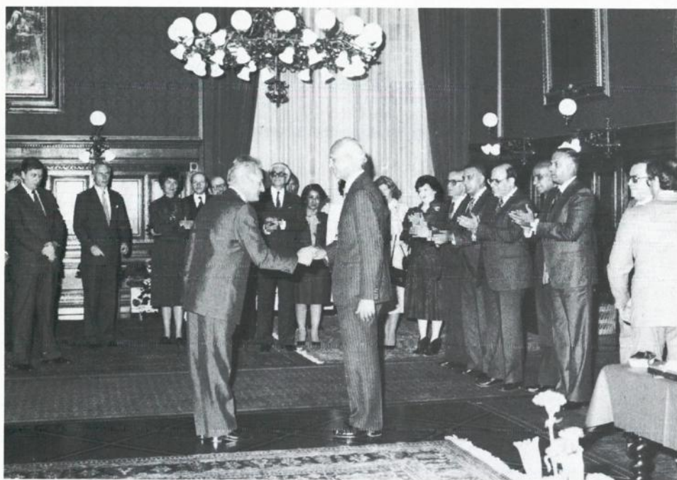
Der Premierminister der Arabischen Republik Ägypten, Dr. Ahmed Fuad Mohieddin, wird bei seinem Besuch im Rathaus von Bürgermeister Leopold Gratz begrüßt