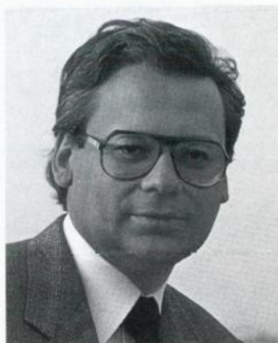
Dr. Erhard Busek, ÖVP Vizebürgermeister Stadtrat