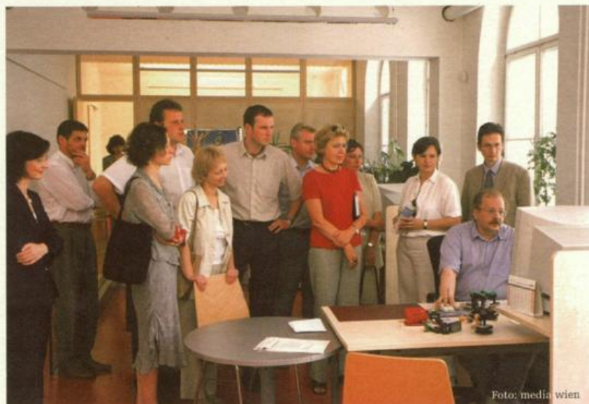
Im Juni war eine Delegation aus Vilnius im Front-Office im 15. Bezirk zu Besuch.

Im Hinblick auf ihre Größe wären besonders hervorzuheben die Empfänge anlässlich des Central & Eastern European Investors Forums (780 Personen), des Festes der neuen Wiener 2003 (700 Personen), des Tiroler Balles 2003 „Hall grüßt Wien“ (768 Personen), des 23 rd Annual Meeting and Scientific Sessions of the ISHLT (International