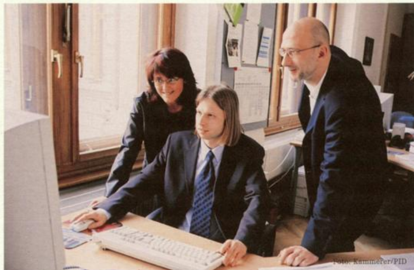
Prüfung einer EDV-Anwendung durch Mitarbeiter der „EDV-Revision“.

EDV-Revisionen legten den Fokus erneut auf die Wirtschaftlichkeits- und Projektprüfung von SAP R/3. Maßnahmen zur Erhöhung der Systemsicherheit wurden einem Follow-Up