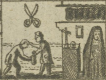
Scher. Feier amper. Geschenete Nonne. 70