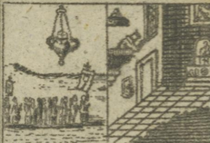
Lampen Mahl schiffen. Freudig hören. Altar. 67