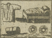
Hemd Bestadt Leinwand. Latylr. 72