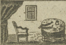
Furbang Seslaf Sessel. Gute Perce. edel-gesteine. 71