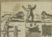
Inde Ehre. Blinde. Felle. Felswerke. 68