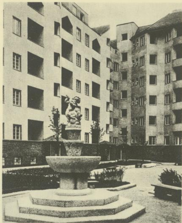
Wohnhausbau X., Quarinplatz 10/12 (131 Wohnungen) Entwurf: Prof. Theiß & Jaksch, Brunnenplastik von O. Thiede Straßenbahn: Ring—Oper/66