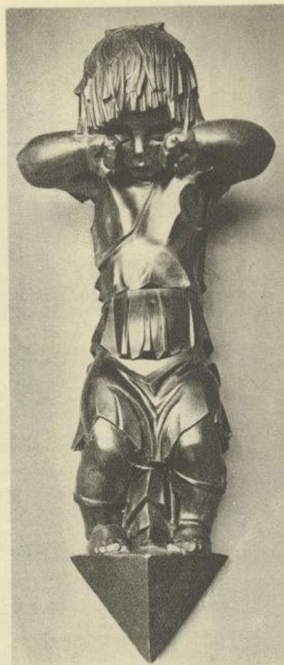
Right: Sculpture of the “Lindenhof” by Josef Riedl