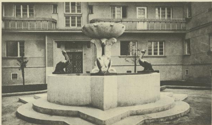
Bronze and Stone Fountain by Alfred Hoffmann, Municipal dwelling Block XI., Geiselbergstr. 60/64