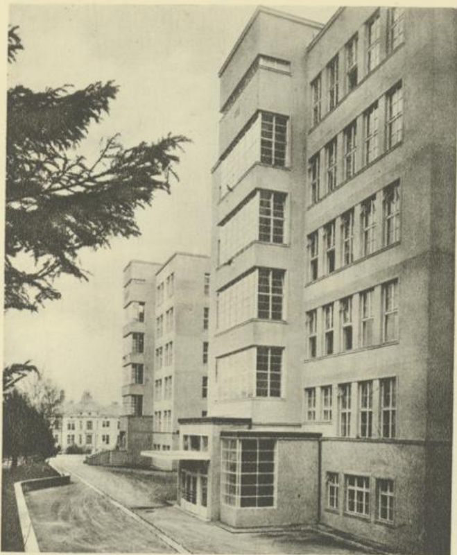
Pavillon für Tuberkulose-Kranke im Krankenhaus der Stadt Wien, XIII., Lainz Entwurf: Egon Riefl und Fritz Judtman Straßenbahn: 59/60