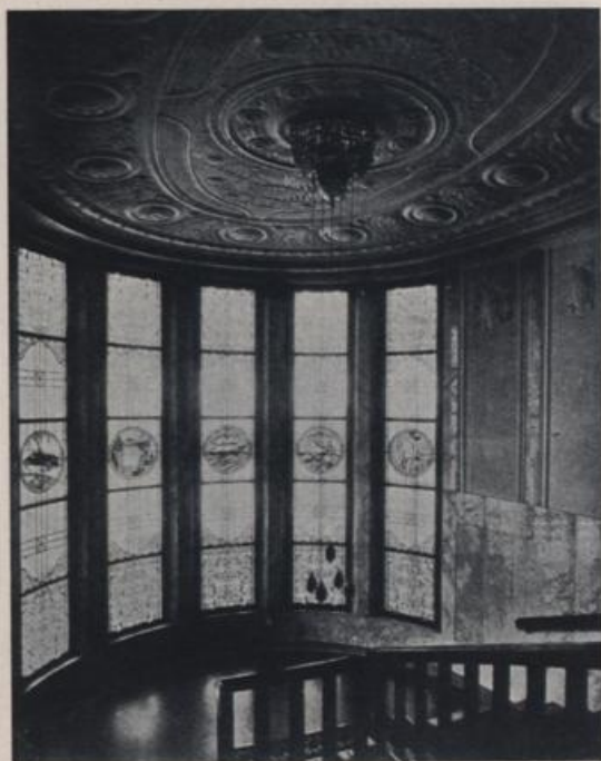
UNFALLVERSICHERUNG DER ÖSTERREICHISCHEN EISEN- BAHNEN STIEGENHAUS 1910-1911