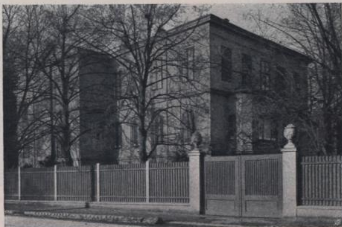
UMBAU PALAIS E. M. W., WIEN, LINZERSTRASSE 452