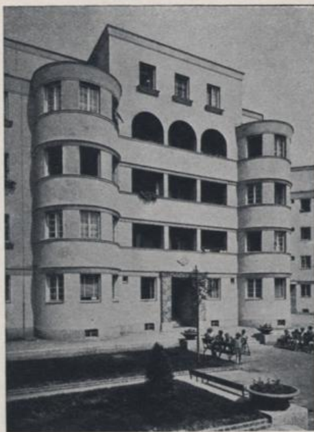
GARTENSTADT XXI., WOHNHAUSBAU DER GE- MEINDE WIEN 1924—1932