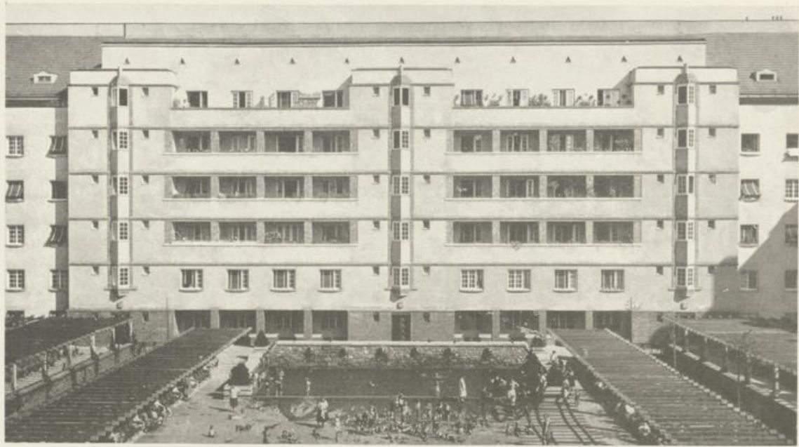
Gartenhof mit Plantschbecken und Pergolen