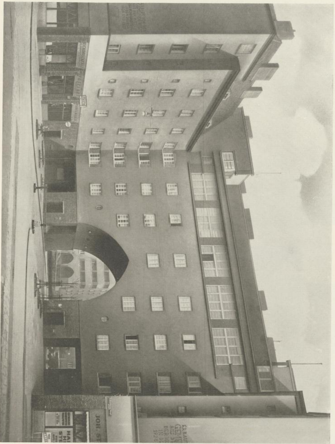
WOHNHAUSANLAGE DER GEMEINDE WIEN III. Bezirk, Kardinal Nagl-Platz, Baumgasse, Rabengasse.