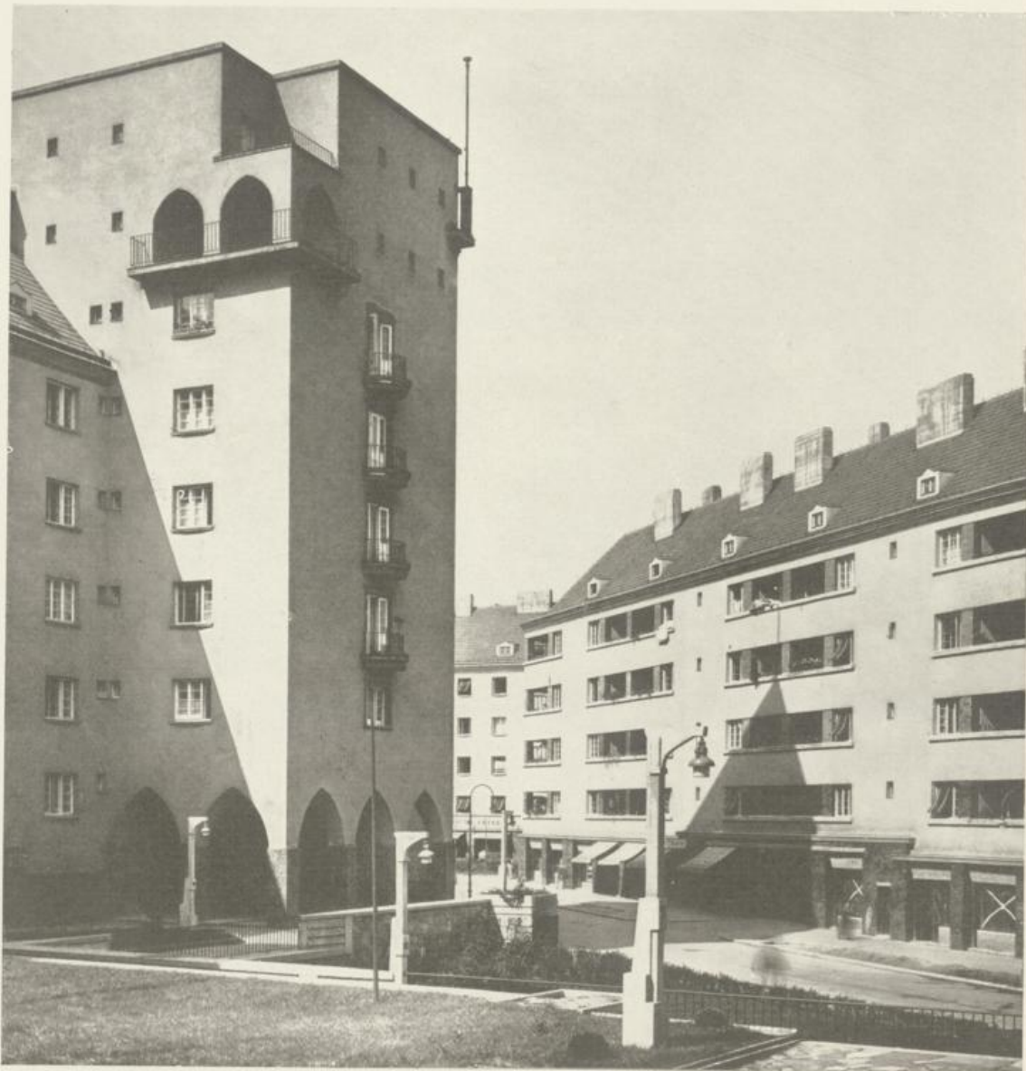
Blick vom erhöhten Platz gegen Rabengasse

WOHNHAUSANLAGE DER GEMEINDE WIEN III. Bezirk, Kardinal Nagl-Platz, Baumgasse, Rabengasse.