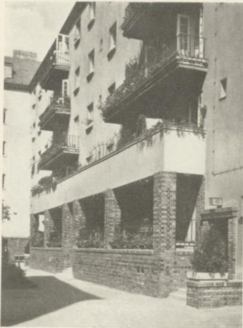
Partie aus einem Gartenhof