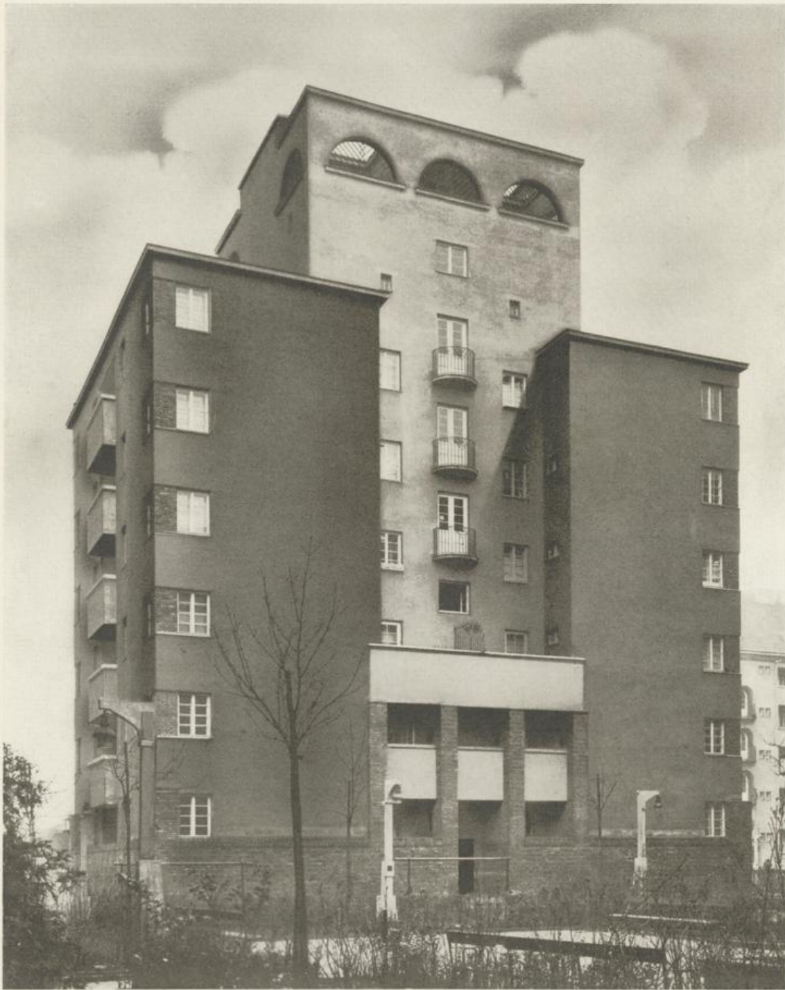
Einzelstehender Baublock am Zusammenstoß von drei Gartenhöfen.