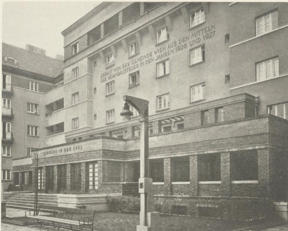
Platzbild mit Eingang zum Theatersaal