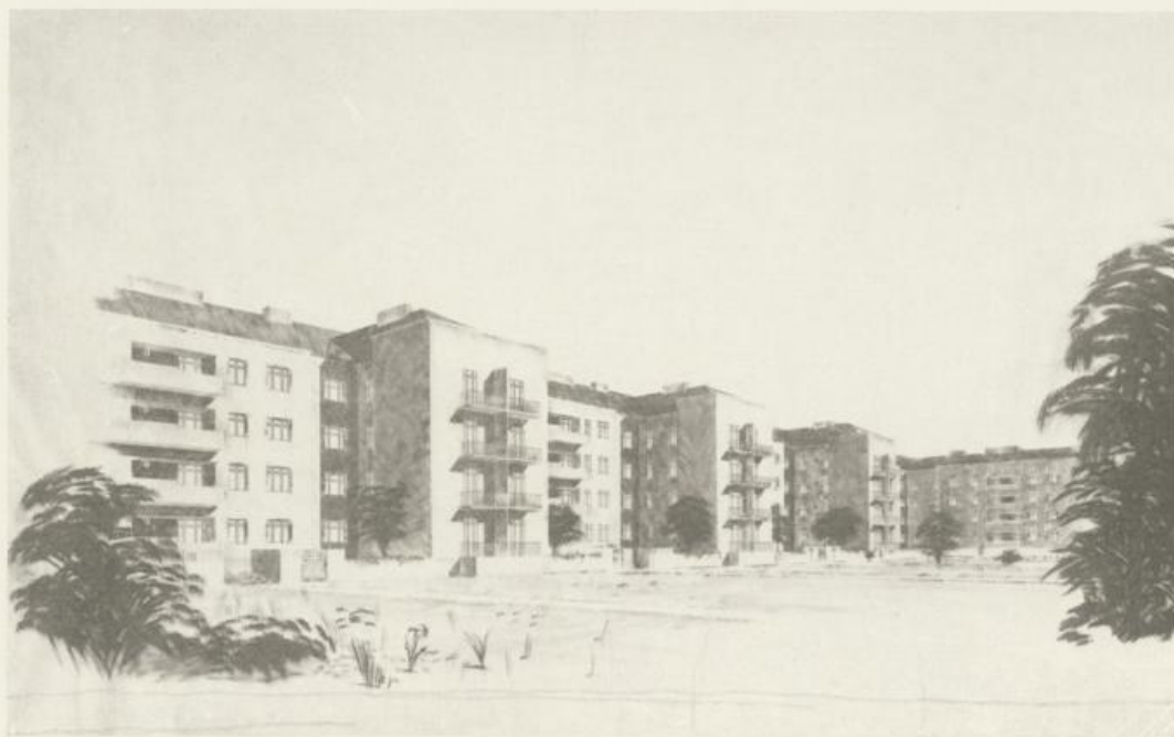
WOHNHAUSANLAGE DER GEMEINDE WIEN IM XXI. BEZIRK, WERNDLGASSE (Im Bau begriffen, 1931)