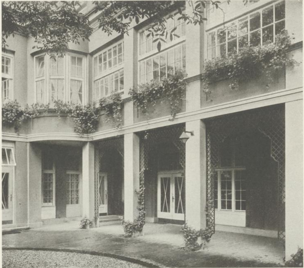
Zubau der Veranda mit Erker