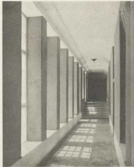
Korridor im Erdgeschoß zu den Stiegen

ein Teil mit Bädern versehen ist, errichtet: Vorraum, W.-C., Wohnküche, 2 Zimmer; Vorraum, W.-C., Küche, 2 Zimmer, Kabinett, Bad; Vorraum, W.-C., Küche, 3 Zimmer, Bad. Die günstigste Grundriß-Disposition der Wohnungen hat sich durch das Hineinrücken des mittleren Teiles des Straßentraktes ergeben; auf der durch die Zurückverlegung entstandenen Fläche wurde um eine Grünanlage, ein zu den beiden Haustoren führender Laubengang angeordnet, dessen Betonpfeiler mit keramisch ausgeführten Blättern umkleidet sind.