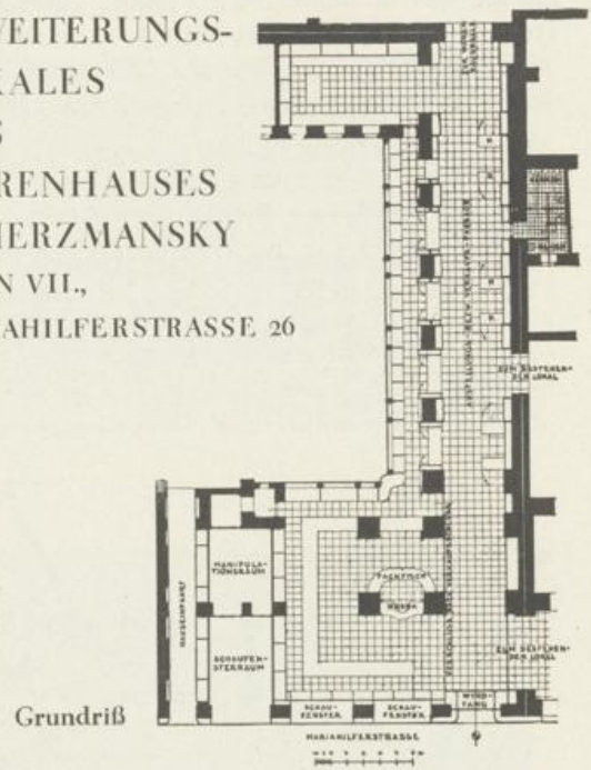
Der wichtigsten Bedingung, daß der Verbindungstrakt zwischen dem zu erweiternden Geschäfts-

1928. SKIZZEN-PROJEKT FÜR DIE UM- UND AUSGESTALTUNG DES ERWEITERUNGS- LOKALES DES WARENHAUSES A. HERZMANSKY WIEN VII., MARIAHILFERSTRASSE 26