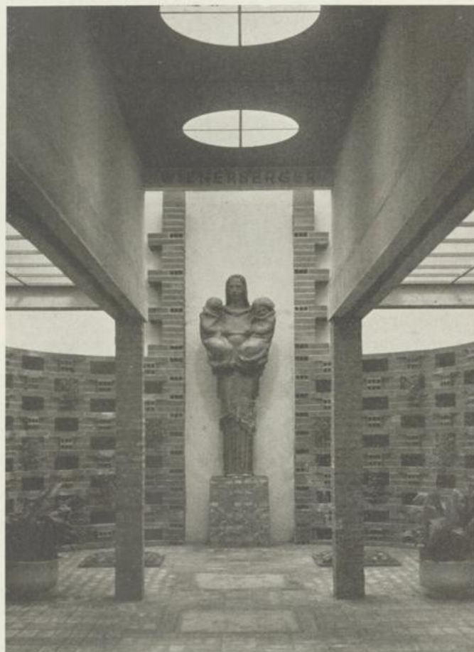
Keramischer Raum für die „Wienerberger Ziegelfabriks- u. Bau-Gesellschaft“ Wien I.