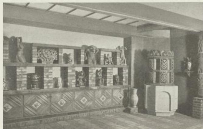
Vorraum zu obigem Raum für kleine keramische Plastiken

Der Fortschritt der modernen Baukeramik in ihren verschiedenartigen technischen Herstellungs- und Anwendungsmöglichkeiten sollte in dieser Portalanlage der Zentral-Verkaufsstelle der österreichischen keramischen Fabriken gezeigt werden; die Proportionen der zur Verfügung gestande-