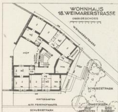
VOLKSWOHNHAUS DER GEMEINDE WIEN, XVIII., WEIMARERSTRASSE, HINTER DEM SCHUBERTPARK. (1924)