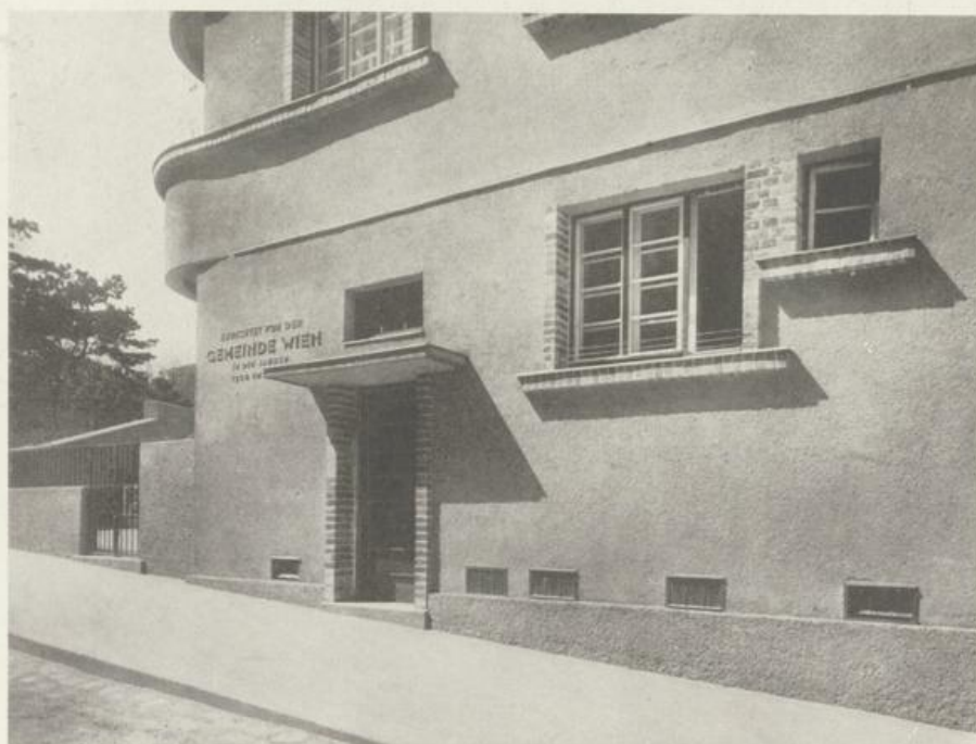
VOLKSWOHNHAUS DER GEMEINDE WIEN, XVIII., WEIMARERSTRASSE