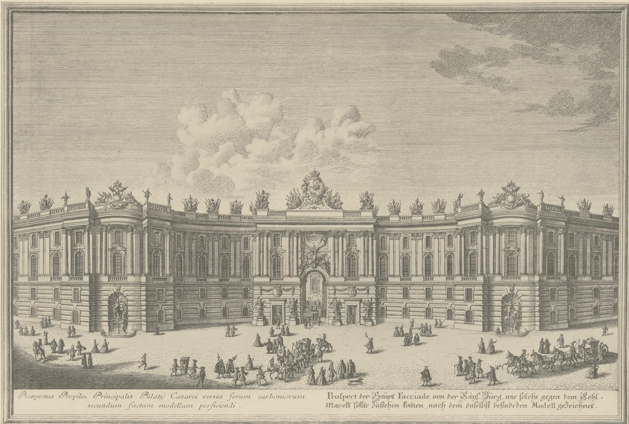
Prospectus Propilei Principalis Palatii Cesarei versus forum carboniarum secundum factam modellam perficiendi.