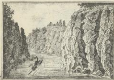
Felsenpartie unt Weltenburg.