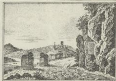
Loewen-Monument u. Abbach.

● STADT ● STÄDTCHEN ● Markt ● Dorf ● Hof ◊ Kloster ◊ Kapelle, Wallfahrt ◊ Schloß.