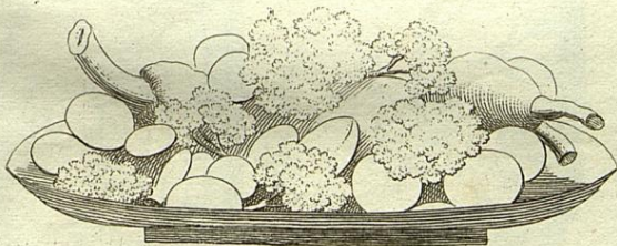
Schopswengel auf englische Art.