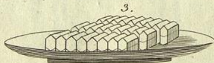
Atletten mit Fleisch Salz.