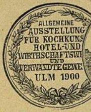
Ulm a. D., Silberne Medaille.