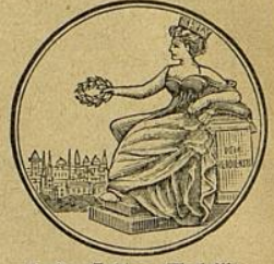
Berlin, Goldene Medaille.

Exposition Internationale Paris 1901 Concours Culinair de Alimentation et d'Hygiène.