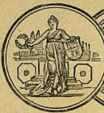
Hamburg, Goldene Medaille.