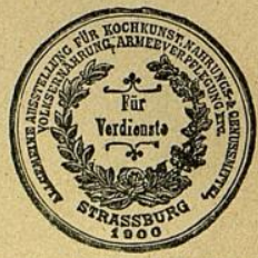
Strassburg i. Els., Gold. Medaille.

Ehrendiplom, Dank und Anerkennung Wien 1901.