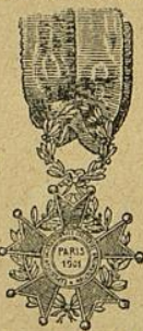
1901 goldene Medaille.