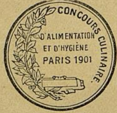
Paris Ehrenkruz und

Sous le haut patronage de Mr. le Ministre du Commerce et de l'Industrie