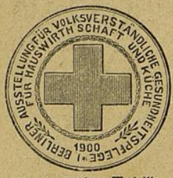
Berlin, Goldene Medaille.