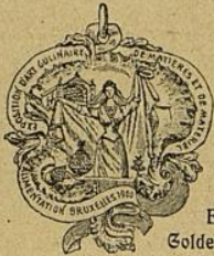
Brüssel, Goldene Medaille.