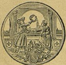
Strassburg i. Els., Gold. Medaille.