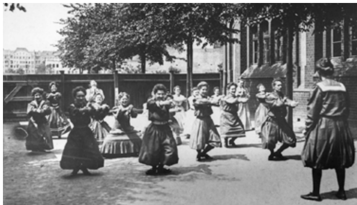
Frauen in Turnkleidern beim Sport um 1850

Sportliche Betätigung verlangt nach Kleidung, die Bewegungsfreiheit bietet und nicht einengt. Traditionell trugen Männer zu Beginn lockere Hosen bis zu den Knien oder solche, die an den Knöcheln enger zuginen. Frauen trugen bei Sport lange Hosen oder blickdichte Strümpfe und darüber ein knielanges Kleid, auch die Frisur musste sitzen: Offene Haare oder ein Zopf waren verpönt, eine Aufsteckfrisur machte das Outfit komplett. Viel Bein- und damit Bewegungsfreiheit bot diese Aufmachung nicht, darüber hinaus war sie mitunter auch gefährlich. Der weite Rock verfang sich immer wieder, schnelles Laufen war nicht möglich, springen oder dergleichen an sich unschicklich. Im Reitsport trugen Frauen seit dem 14. Jahrhundert bis zum 1. Weltkrieg ein Reitkleid und mussten im Damensitz - beide Beine sittlich auf einer Seite - reiten, der Damensattel wurde in Deutschland 1928 für das Springreiten verboten.