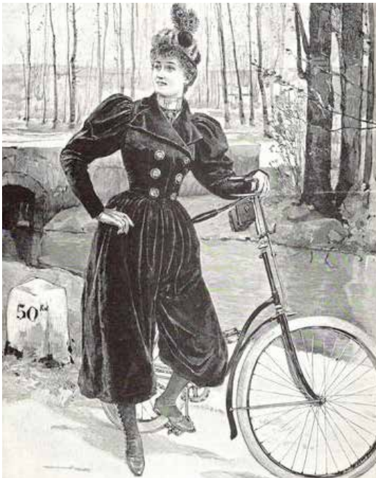
Fahrradoutfit mit Bloomers um 1894 Harpers Bazaar

Über das Radfahren rutschten die Rocksäume immer höher und es wurden unterschiedliche Arten von Hosen bzw. Rockhosenkombinationen entwickelt – also Hosenröcke, Zuavenröcke (außen Rockoptik, drunter trägt Frau Hose) und Pumphosen, genannt Bloomers. Das Fahrrad verhalf der von der amerikanischen Frauenrechtlerin Amelia Bloomer entworfenen weiten, bauschigen Hose zu internationaler Bekanntheit.