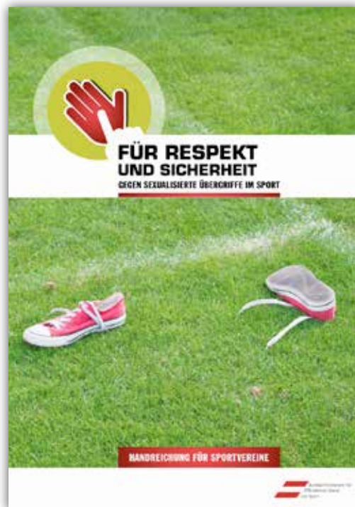
Deckblatt der Handreichung „Für Respekt und Sicherheit“.