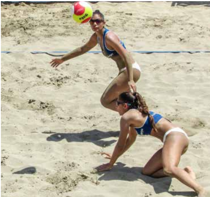
Einsatz eines Beachvolleyballteams 2016

werden. Gleichzeitig haben diese Kleiderordnungen stark zum attraktiven Image des Beachvolleyballs beigetragen. Sie haben gleichzeitig dazu geführt, dass die Damen-Liga von Anfang an ebenfalls medienwirksam war. Man könnte also zu dem Schluss kommen, dass es durch eine sexistische Kleiderordnung zu einer komplexeren Gleichstellung in einer Sportart gekommen ist. Bei den olympischen Spielen in Rio 2016 hat sich jedoch gezeigt, dass der Beachvolleyballplatz und seine Kleiderordnung nach wie vor Austragungsort der Ausverhandlung gesellschaftlicher Normen ist. Die muslimische Ägypterin Doaa Elghobashy konnte an dem Turnier teilnehmen, da sie auf Grund der liberalisierten Kleiderordnung nun ihr Hijab auch während des Spiels tragen durfte. Ihre Bekleidung wurde in den Medien lautstark diskutiert – vom „culture clash“ war die Rede. Die Debatte ist in diesem Kontext insofern relevant, als dass sie aufzeigt, dass wiederum – wenn auch diesmal aus einer anderen Perspektive – nur debattiert wurde, wie sich Frauen zu kleiden haben und die sportliche Leistung in den Hintergrund rückte.