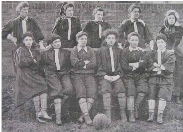
Damenteam North London 1895