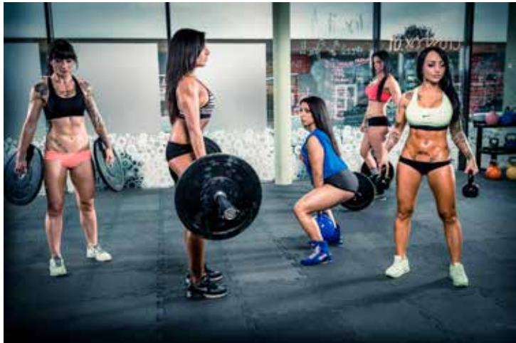
Starke Mädchen

Das Vorurteil, dass muskulöse Frauen dem gängigen Schönheitsideal nicht entsprechen, wird zusätzlich von den Medien genährt. So schreibt ein österreichisches Frauen- und Lifestyle-Magazin über muskulöse prominente Frauen: „Fitness-Freaks. Zu viel Sport entstellt die Stars“. Besonders Sängerin Madonna wird für ihren Körper heftig kritisiert: „Vor allem ihre Arme sind mittlerweile einfach nur noch abschreckend: komplett aufgepumpt und männlich. Ihre Adern platzen fast und weibliche Kurven sind bei der Queen of Pop kaum noch vorhanden. Ihr Ex-Mann Guy Ritchie erzählte nach der Scheidung: ‚Im Bett mit ihr zu sein, war wie kuscheln mit einem Knorpel‘“, heißt es in dem Artikel. „Wo bleibt die Weiblichkeit“, fragt das Magazin.