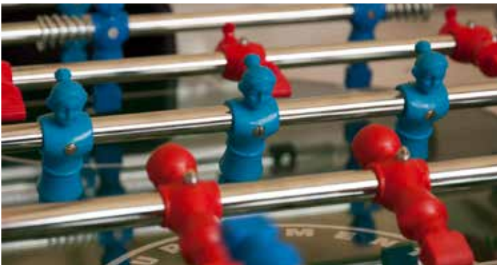
Gender-Wuzler des Vereins 100% Sport

2015 wurde vom Österreichischen Sportministerium die Strategieguppe „Gender Equality im Sport“ eingesetzt, die gemeinsam mit dem Sportministerium für den Inhalt und die Umsetzung