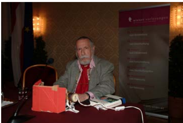
Georg Stefan Troller

Eröffnungsveranstaltung der Konferenz „Exil: Glaube und Kultur. 1933–1945: ‚Der Tag wird kommen‘ (Lion Feuchtwanger)“ der Internationalen Feuchtwanger Gesellschaft und des Instituts für Zeitgeschichte der Universität Wien