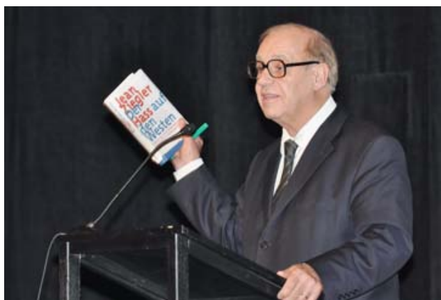
Jean Ziegler