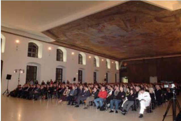
Wiener Vorlesung von Kardinal Schönborn über Schöpfung und Evolution in der voll besetzten Aula der Wissenschaften