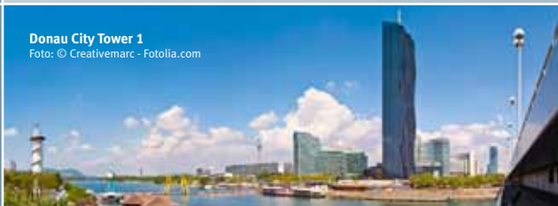
Donau City Tower 1