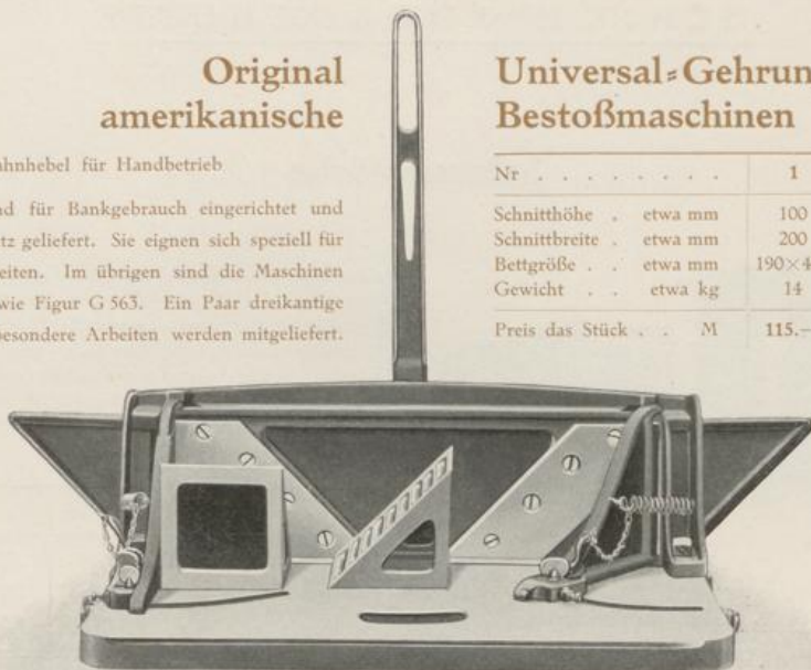
Figur G 564. Kabelwort: Glauco