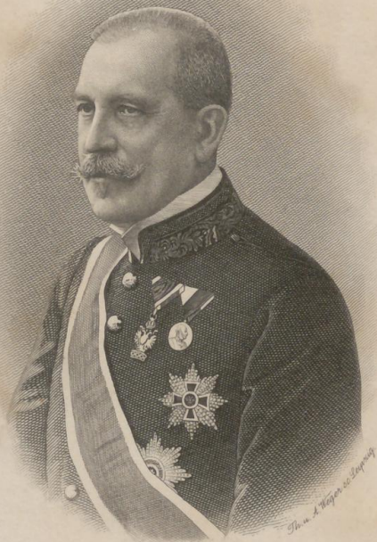
Aloys Freiherr Lexa von Aehrenthal, K. u. K. Geh. Rat, Minister des Kaiserl. und Königl. Hauses und des Aupern, Vorsitzender im gemeins. Ministerrate.