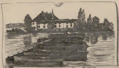
Gruss aus Seebad Kammer

Ich habe auf keine Antwort, da ich mir Zeit & Wo und Wie setzen in. nicht vermag, wie lange mich dort verhalten;