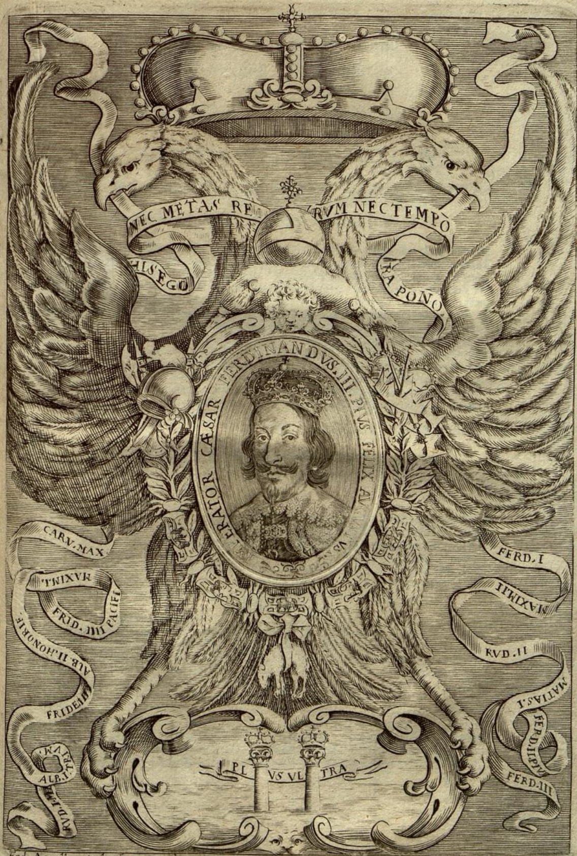
Ed. Agnelli sculpsit