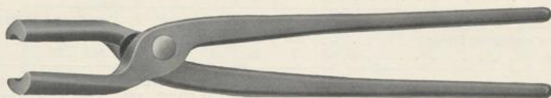
Figur D43. Rundzange.