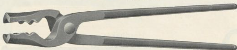
Figur D44. Kabelwort: Dammar .

Jede einzelne Zange faßt alle Bleche, Fasson-, Rund-, Vierkant- und Flacheisen usw. gleich sicher und fest. Die Zangen eignen sich auch gut zum Stauchen, so daß das lästige Wechseln wegfällt. Sie sind aus bestem Material geschmiedet, leicht und stabil und haben federnde Schenkel. 1 Satz genügt für jedes Schmiedefeuhr und ersetzt viele Spezialzangen.