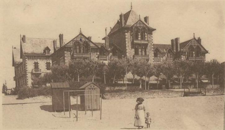
Collection artistique du Grand Hôtel de la Plage

LA BAULE - Grand Hôtel de la Plage ou Maushpa