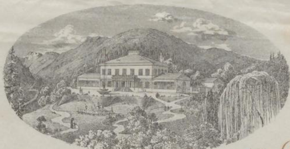
Berghof zu Lilienfeld.