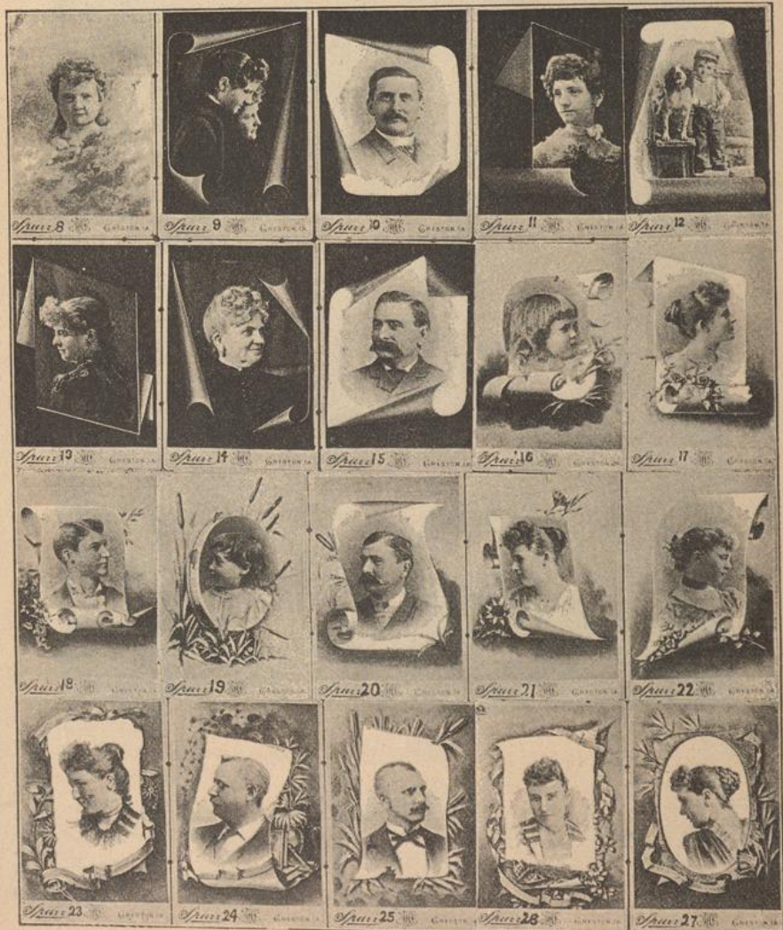
Fig. 2514 bis 2540.