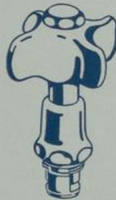
Ausführung „VI“ Nichtsteigende Spindel mit Propellergriff