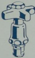
Ausführung „V“ Nichtsteigende Spindel mit Seesterngriff