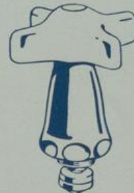
Ausführung „X“ Verdeckte Spindel mit Porzellangriff