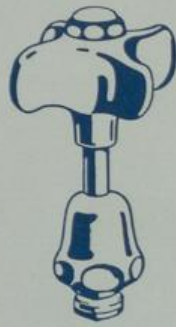
Ausführung „II“ Normale Spindel mit Propellergriff