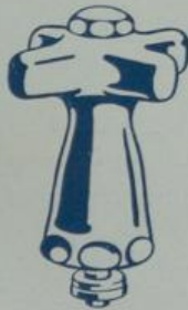
Ausführung „VIII“ Verdeckte Spindel mit Seesterngriff