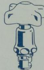
Ausführung „VII“ Nichtsteigende Spindel mit Porzellangriff