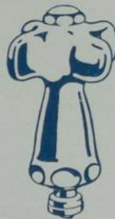
Ausführung „IX“ Verdeckte Spindel mit Propellergriff