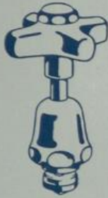
Ausführung „I“ Normale Spindel mit Seesterngriff

Falls bei Bestellung keine andere Vorschrift erfolgt, werden alle Oberteile nach Ausführung I geliefert.