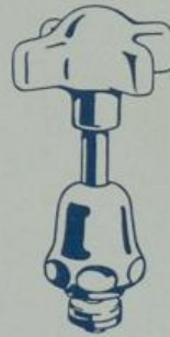
Ausführung „III“ Normale Spindel mit Porzellangriff