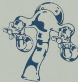
S. 7386 1/2", 3/4"

zum Einmauern, mit 2 Durchgangshähnen S. 7000, Verbindungs-T-Stück und Wannen einlauf S. 7373