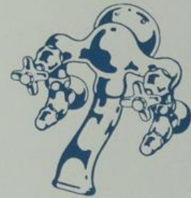
S. 7387 1/2", 3/4"

mit Knieholländern, Gußrosetten, Wandscheibe und breitem Auslauf