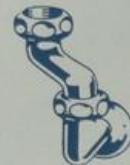
S. 7398 1/2", 3/4", 1"

Eckregulierhahn mit geschlossener Kappe, Mutter und Gußrosette für Batterien