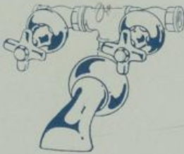
S. 7385 1/2", 3/4"

zum Einmauern, mit 2 Durchgangshähnen S. 7000, Verbindungs-T-Stück und Wannen einlauf S. 7373