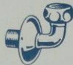
S. 7396 1/2", 3/4", 1"

Gerader Holländer mit Mutter und Gußrosette für Batterien