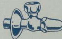
S. 7397 1/2", 3/4", 1"

Knieholländer mit Mutter und Gußrosette für Batterien