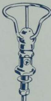
S. 7594 3/8"