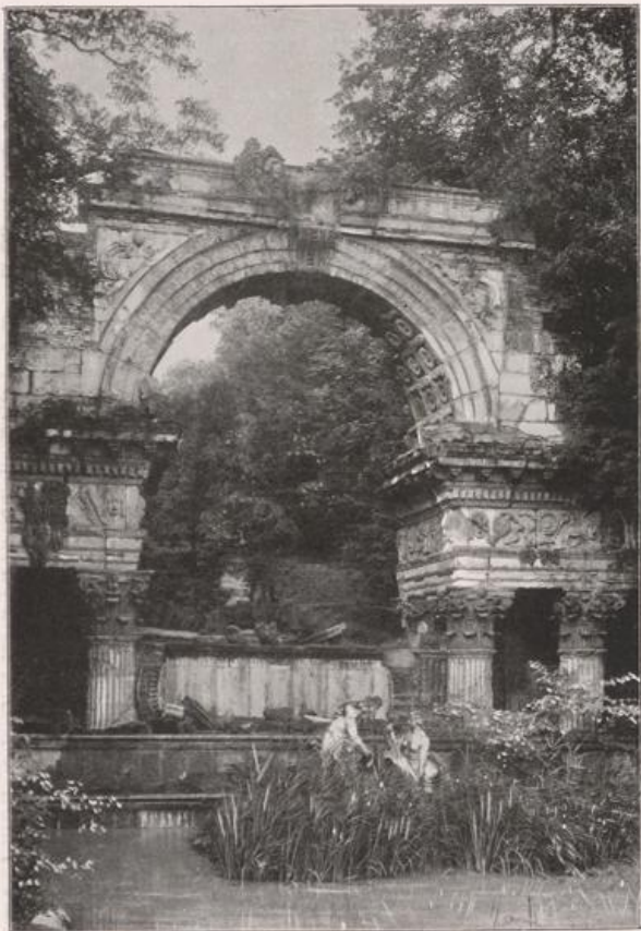
DIE RÖMISCHE RUINE von F. VON HOHENBERG.