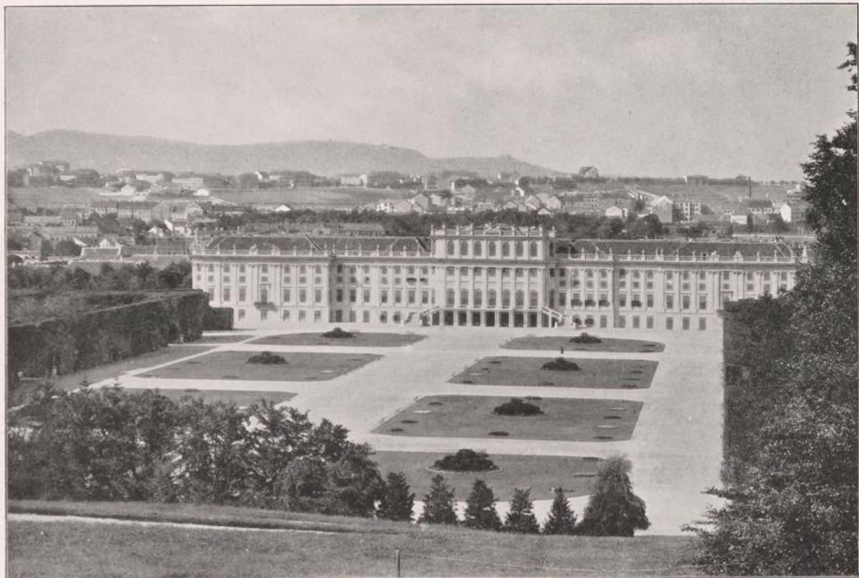
LUSTSCHLOSS SCHÖNBRUNN. (Erbaut von FISCHER VON ERLACH.)